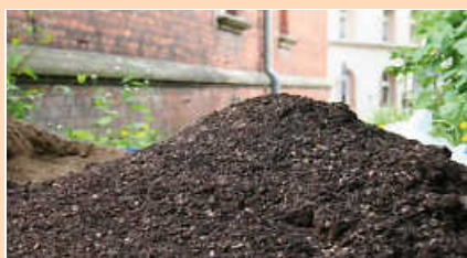
Nährhumus B 1