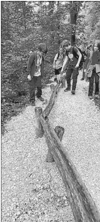
Hindernisse und Laufwege