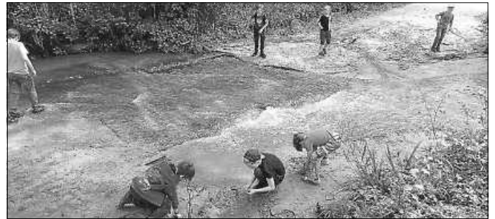
Wasserfurt über den Weg

die Bärenhöhle, bevor wir die letzte Stunde unseres Aufenthalts auf dem schönen Waldspielplatz verbrachten. Dann ging es steil bergab bis zur Bushaltestelle und ab da nach Hause.