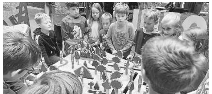
Welcher Baum darf gefällt werden

Der „Urbacher Walderlebnispfad“ als unser nächstes Tagesziel lag ziemlich versteckt mitten im Wald. Ab der Bushaltestelle am Ortsrand brauchte man 20 Minuten zu Fuß immer steil bergauf! Dann, endlich: der Holzkugel-Automat markierte den Start des Erlebnis-Weges. Mit vielen Kugeln im Gepäck ging es eine nach der anderen Kugelbahn abwärts im urwaldartigen Wald bis zum tiefsten Punkt, der Bärenbach-Furt über den Weg, durch den Regen der Vortage zu einem schnellen, unpassierbaren Fluss geworden. Nach einem Zick-Zack-Weg über schiefe Holzbrücken führte uns der Weg wieder bergauf. An acht Stationen konnten wir die Geschichte lesen, warum der Urbach zum Bärenbach wurde und entdeckten zu guter Letzt