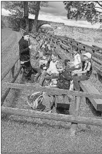
Warten auf die Flugshow

Am nächsten Tag fuhren wir nach Beilstein. Unser Ziel war die Falknerei auf der Burg Hohen-Beilstein. Wir begutachteten zunächst auf einem Rundgang das Zuhause der Tiere, die alle zur Falknerei gehören. Exklusiv für uns wurde eine etwa 1-stündige Flugshow geboten, mit Uhu, Milan, Bussard und Adler. Kleine Andenken wurden danach noch gekauft, dann ging es den Weinberg hoch zum Waldspielplatz, wo man sich wunderbar in der Natur austoben konnte. Auf dem Rückweg ein kleiner Halt in Großbottwar mit dem Besuch der Eisdielen am Rathaus und einem schönen Spielplatz an der Stadtmauer, dann ging es auch schon wieder zurück nach Kirchberg.