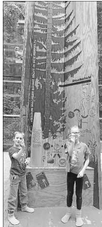
Photosynthese mit Traubenzucker als Ergebnis

Am letzten Tag des Ferienprogramms fuhren wir mit S- & U-Bahn auf die Waldau zum Stuttgarter „Haus des Waldes“. Leihsocken an, eine kurze Begrüßung und Einführung durch das Hauspersonal und dann wurden 90 Minuten lang die einzelnen Stationen auf zwei Etagen erkundet und gespielt. Ein Mittagssupper im Freien zum Abschluss des Besuches und schon ging es wieder zurück nach Kirchberg.