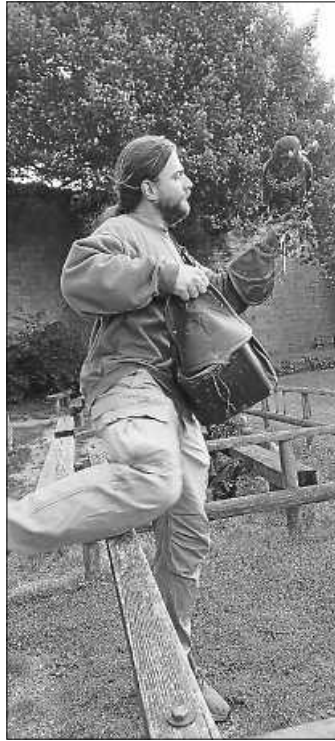
Der Falkner und sein Vogel

Am nächsten Tag fuhren wir nach Beilstein. Unser Ziel war die Falknerei auf der Burg Hohen-Beilstein. Wir begutachteten zunächst auf einem Rundgang das Zuhause der Tiere, die alle zur Falknerei gehören. Exklusiv für uns wurde eine etwa 1-stündige Flugshow geboten, mit Uhu, Milan, Bussard und Adler. Kleine Andenken wurden danach noch gekauft, dann ging es den Weinberg hoch zum Waldspielplatz, wo man sich wunderbar in der Natur austoben konnte. Auf dem Rückweg ein kleiner Halt in Großbottwar mit dem Besuch der Eisdielen am Rathaus und einem schönen Spielplatz an der Stadtmauer, dann ging es auch schon wieder zurück nach Kirchberg.