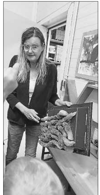
Waben in freier Natur

Waben wurden begutachtet, die Zentrifuge zum Schleudern von Honig ebenso wie ein Brutkasten für Bienen-Königinnen. 150 Bienenvölker mit etwa 8 Millionen Bienen gehören zur „Imkerei am Turm“. Und noch viel mehr. Auf dem Außengelände entdeckten wir Schlupflöcher von Wild-Bienen, Wachteln und ihre Mini-Eier, Hühner samt schwangerer Eselin und einen großen Teich mit Kaulquappen und Fröschen. Zum Abschluss erwartete uns ein frisch gebackener Hefezopf mit Frühlingshonig, bevor viele ein Souvenir mit nach Hause brachten: neben Honig u. a. noch Wachskerzen.