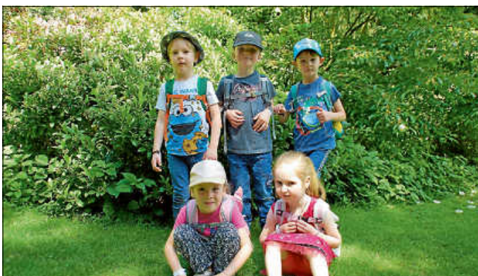
Tschüss, ihr Kängurus!