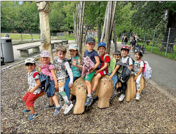
Und TSCHÜSS Ihr Elefanten