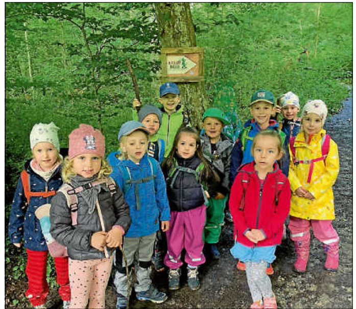
Und TSCHÜSS Ihr Fohlen

Liebe „Großen“ der Kita Schulstraße! Wir sagen „Bei uns ist Schluss – ab zu KigaPlus“ und wünschen Euch für eure Zeit in KigaPlus viel Glück, viele neue Freunde und unvergessliche Momente! Wir wünschen Euch auf Eurem Lebensweg das Beste, was die Welt Euch geben kann! Dass Ihr an eure Ziele kommt, irgendwann. Alles Liebe und Gute von ganzem Herzen wünschen Euch eure Erzieherinnen der Kita Schulstraße.