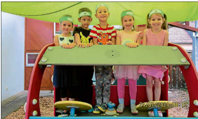
Tschüss, ihr roten Kleckse!