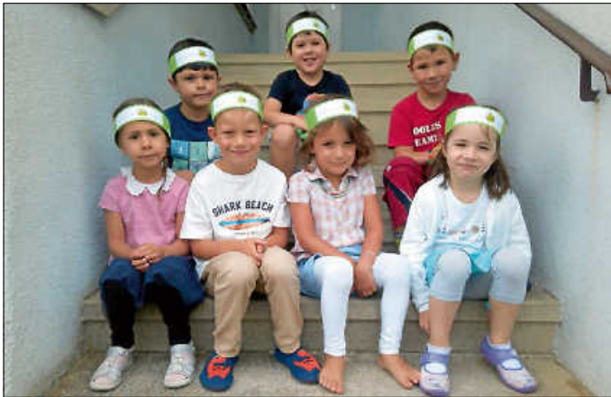
Tschüss, ihr Bananenkinder!

Liebe „Großen“ der Kita Pfarrgartenstraße! „Für dich ist hier jetzt Schluss – ab mit dir zu KigaPlus!“ Wir wünschen euch von ganzem Herzen eine wunderschöne, unvergessliche und ereignisreiche Zeit in KigaPlus. Viel Glück, Gesundheit, Kraft und Geduld für euren Weg in die Zukunft. Das wünschen euch von ganzem Herzen eure Erzieherinnen der Kita Pfarrgartenstraße