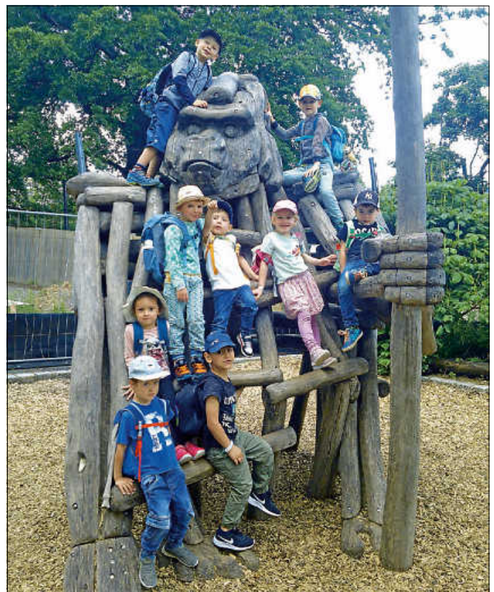
Und TSCHÜSS Ihr Rehe