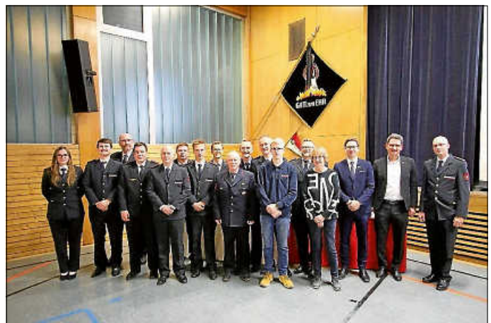
Gruppenfoto mit allen Beförderten und Geehrten